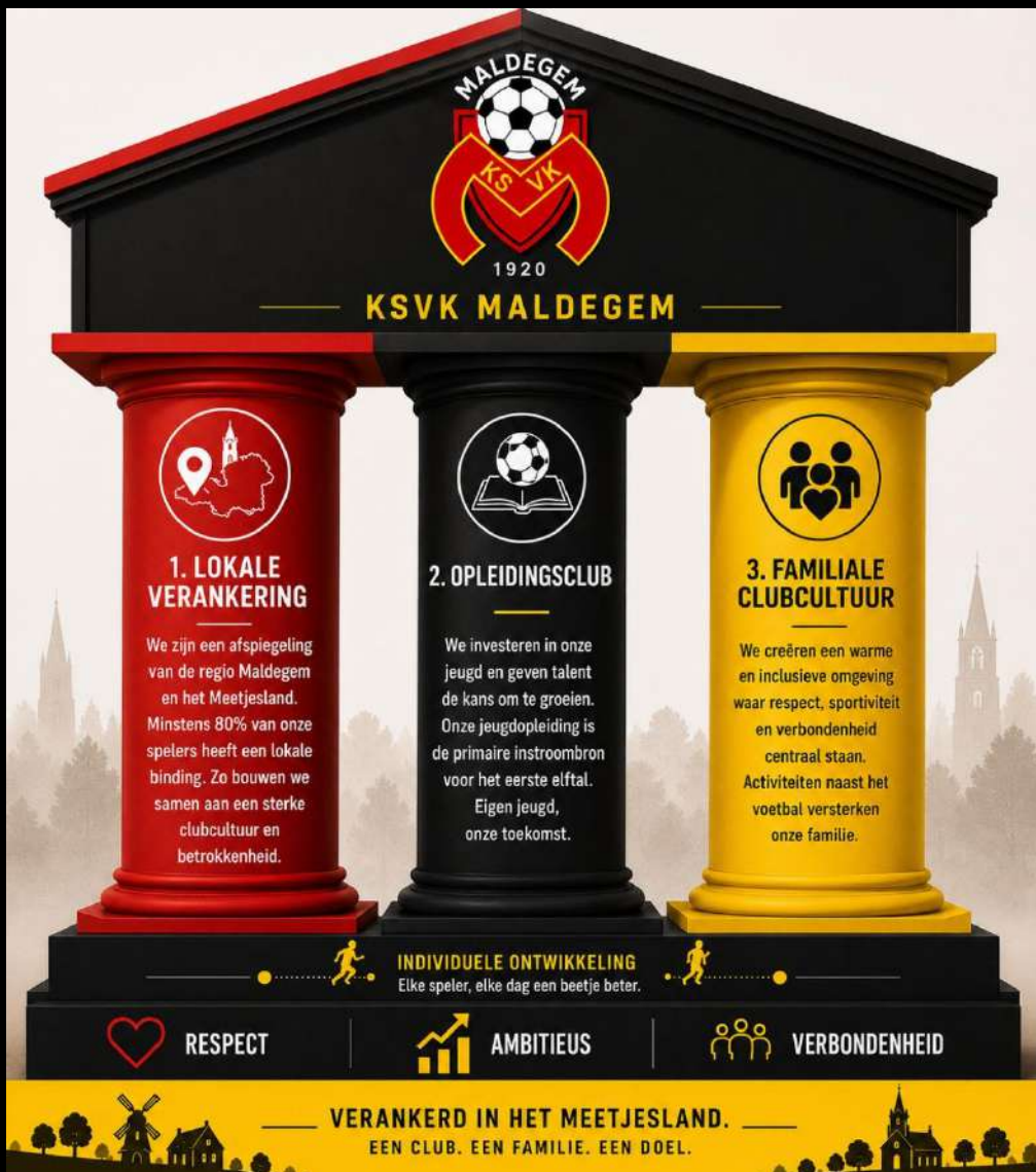
Figuur 2: Visuele weergave identiteit van de club